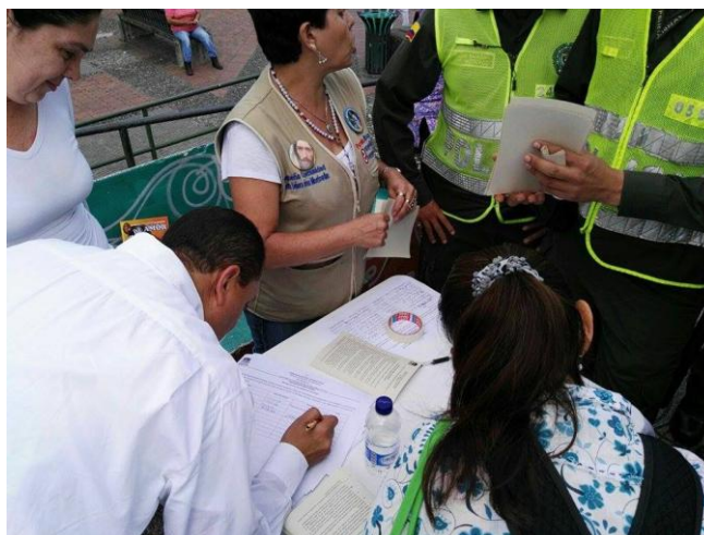
Secretario Privado de la Gobernación del Quindío ratifica su compromiso por Armenia y el departamento.