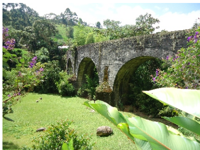
Puente El Amparo- Sector Boquía

Del 1 al 9 de septiembre, por las veredas de Salento, 'Gira del patrimonio vivo salentino "creer en lo que somos" en diferentes horarios coordinados con la comunidad