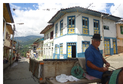
Por las calles de Génova

Actividad: Exposición Fotográfica del Patrimonio Arquitectónico del Bello Rincón Quindiano Hora: todo el día en horario de atención biblioteca Lugar: Biblioteca Pública Municipal Organiza: Subsecretaría de Cultura, Deportes y Turismo de Génova