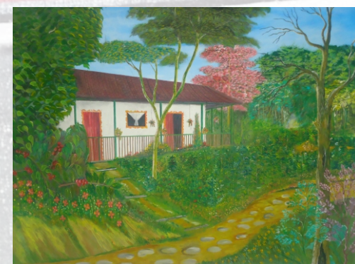
Vivienda Cafetera. Obra artística. Colección Particular

3:00 p.m, en el Centro Cultural Parque Museo del Oro Quimbaya. El Patrimonio Agrario Cafetero. Portadores de valores, conocimientos tradicionales en torno a la vivienda cafetera.