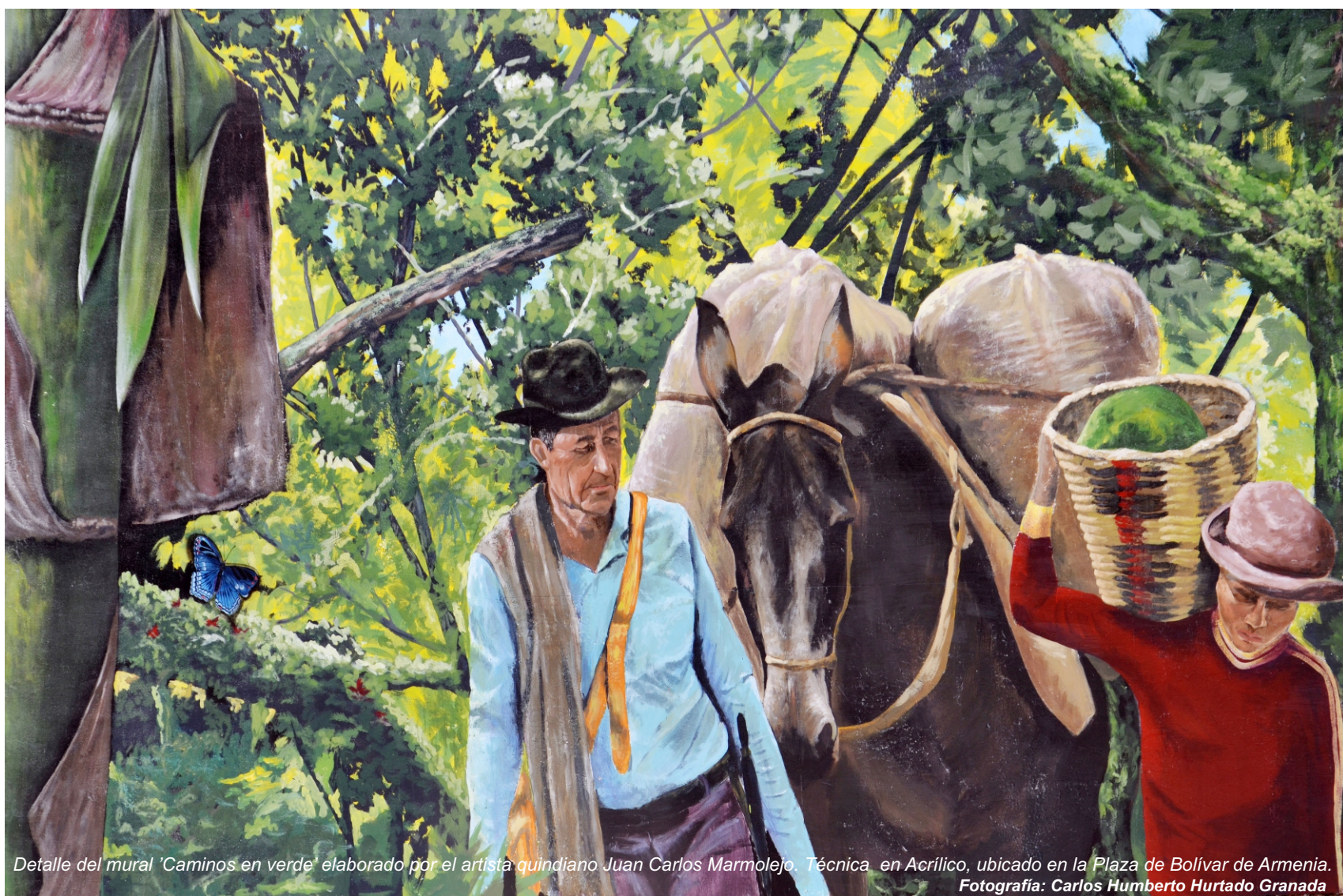
Detalle del mural 'Caminos en verde' elaborado por el artista quindiano Juan Carlos Marmolejo. Técnica en Acrílico, ubicado en la Plaza de Bolívar de Armenia.

Gobernación -Secretaría de Cultura- Jefatura de Patrimonio y Artes