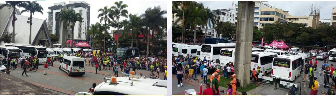
Logística por parte de los organizadores en la plaza de Bolívar de Armenia