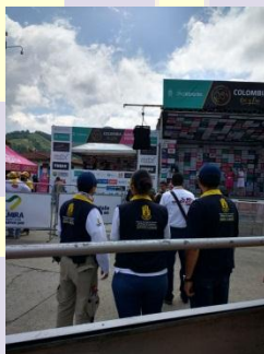
Personal de apoyo en campo a OMGERD Salento