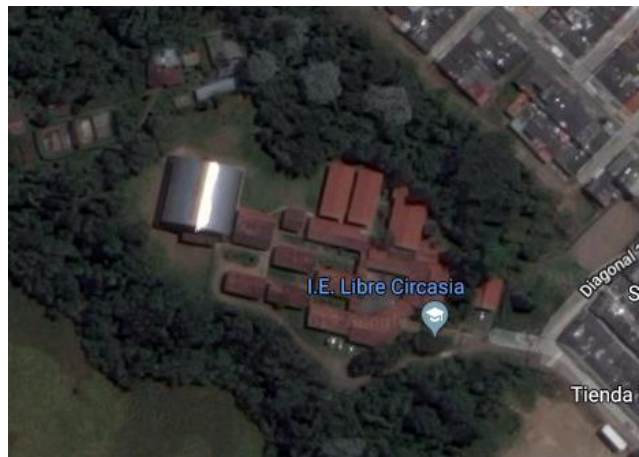
Imagen 2. Institución educativa Libre, fuente Google Maps