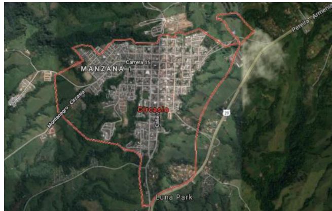
Imagen 1. Municipio de Circasia, localización I.E. Libre