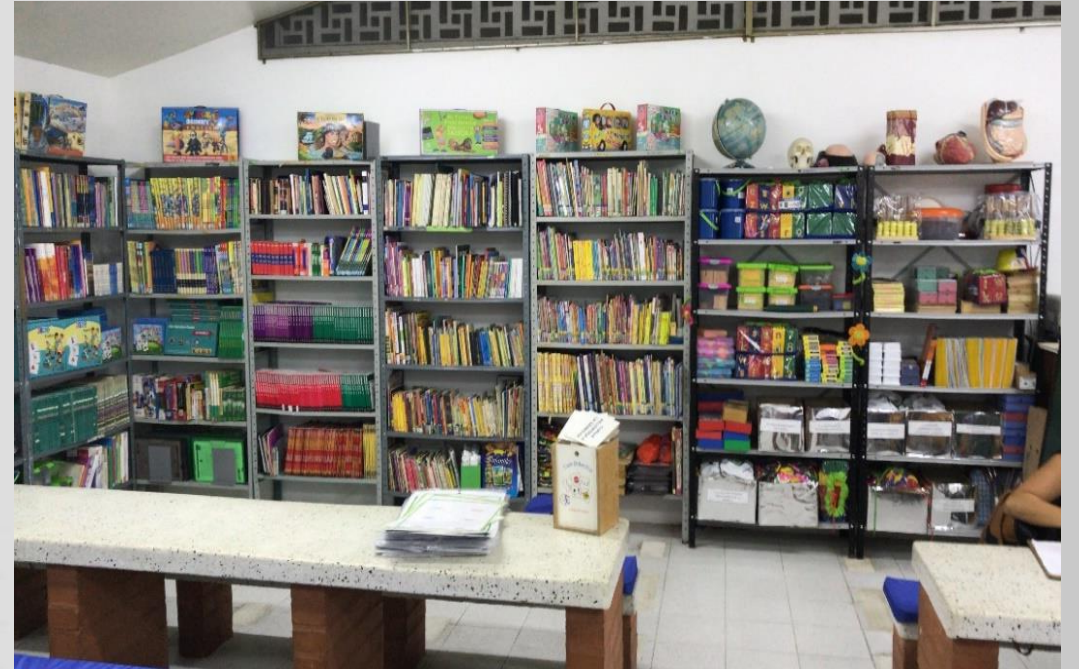
Entrega material didáctico, pedagógico y de juego para 54 instituciones

Porcentaje de avance físico: 65.29% Porcentaje de avance Financiero: 71.12%