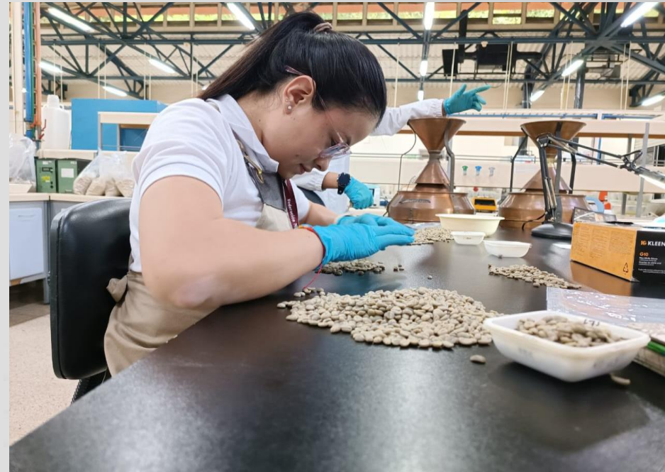
Análisis físico-químico de muestras de café pergamino seco. Muestras recolectadas en el marco del proyecto

Porcentaje de avance físico: 61.03% Porcentaje de avance financiero: 71.62%