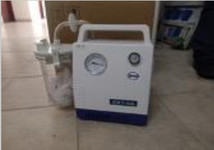
Equipos biomédicos, dotación Hospital del Sur

SGR-ASIGNACIONES DIRECTAS (ARMENIA): $105.183.861,93