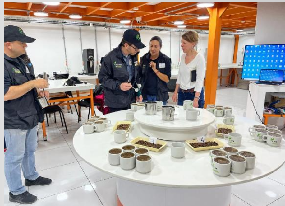
Análisis de calidad de café de 5 muestras de diferentes Municipios beneficiarios del proyecto