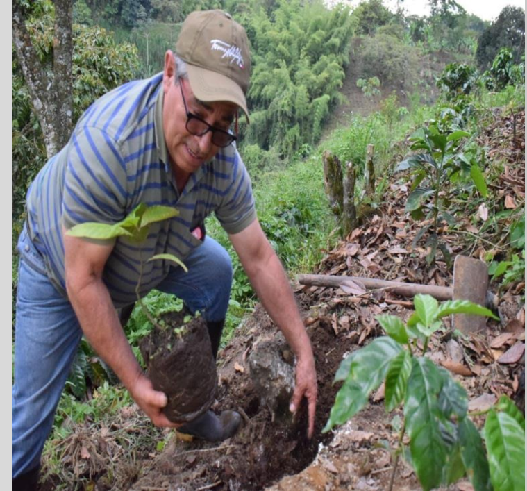
Siembra por parte del propietario del predio La Cabaña