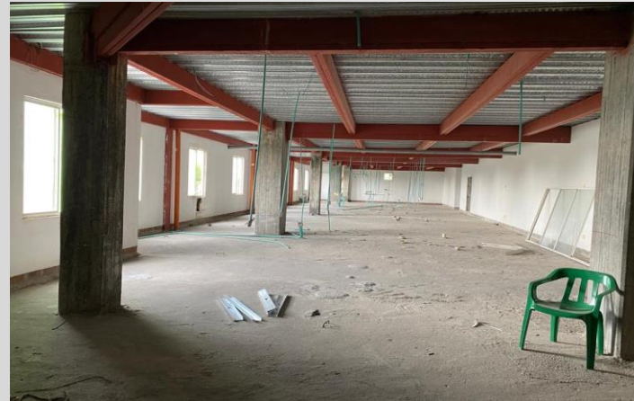
Adecuación Red salud Armenia-sede unidad intermedia del sur