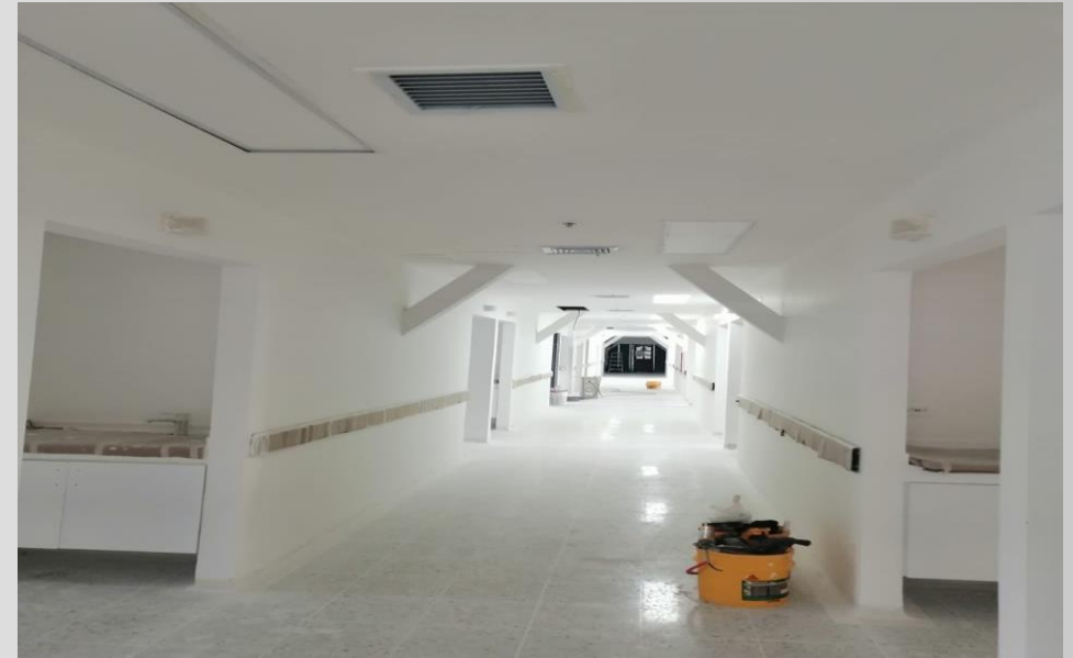
Piso 4 edificio 3: Remodelación y modernización de 17 habitaciones para la zona de hospitalización general adultos