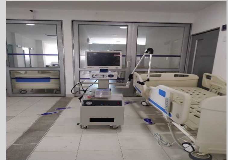
Recepción de equipos biomédicos almacén Ese Hospital La Misericordia. Calarcá, Quindío