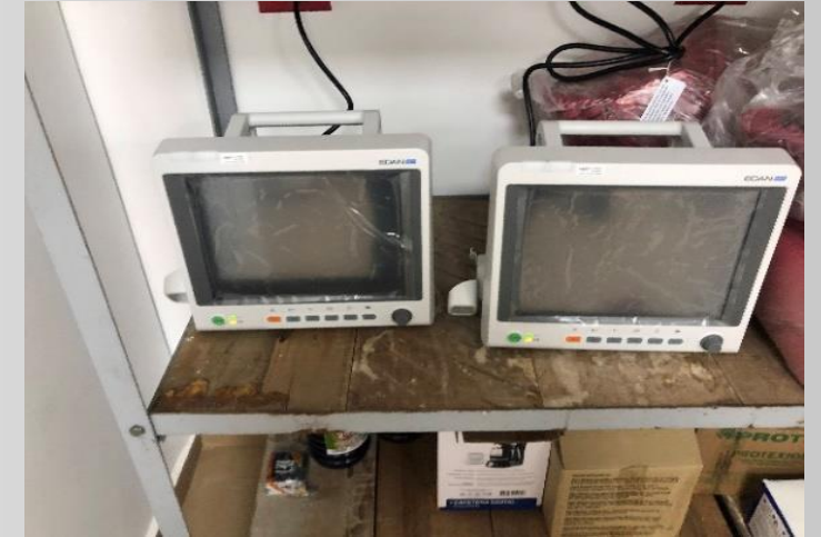
Recepción de equipos en almacén biomédicos ESE Hospital San Vicente de Paul. Circasia, Quindío