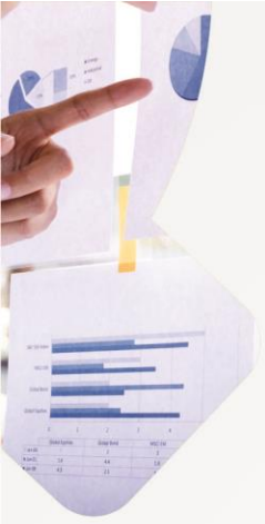
Tabla 2. Saldos de Recursos Sistema General de Regalías SGR Plan de Desarrollo “TU Y YO SOMOS” Quindío 2020 – 2023